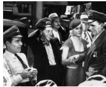
1932 VIRTUE d'Edward Buzzell avec Fred Santley, Carole Lombard, Pat O'Brien