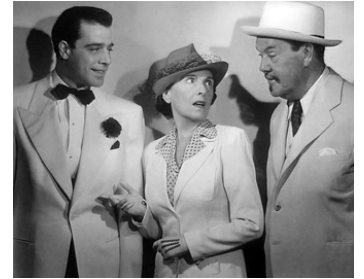
1940 CHARLIE CHAN IN PANAMA de Norman Foster avec Mary Nash, Sidney Toler