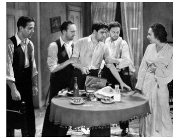
1932 UNE ALLUMETTE POUR TROIS (Three on a Match) de M. LeRoy avec H. Bogart, A. Dvorak