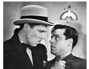
1935 THE HEADLINE WOMAN de William Nigh avec Roger Pryor