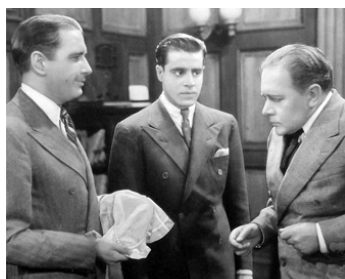
1935 THE SPANISH CAPE MYSTERY de Lewis D. Collins avec Donald Cook