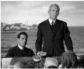
1937 CAPITAINES COURAGEUX (Captains Courageous) de V. Fleming avec Ch. Grapewin