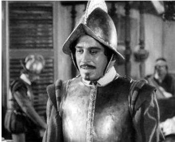
1940 L'AIGLE DES MERS (The Sea Hawk) de Michael Curtiz