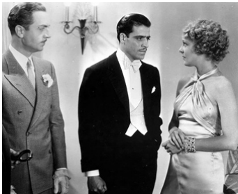
1933 MEURTRE AU CHENIL (The Kennel Murder Case) de M. Curtiz avec W. Powell, H. Vinson