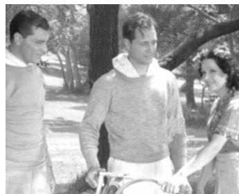
1943 LA FILLE DE MONTERREY (The Girl from Monterey) de W. Fox avec T. Frost, Armida