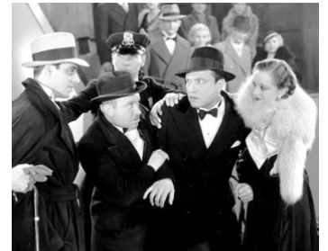
1934 TAKE THE STAND de Phil Rosen avec Vince Barnett, Thelma Todd