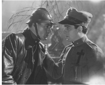
1932 L'ADIEU AUX ARMES (A Farewell to Arms) de Frank Borzage avec Gary Cooper