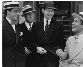
1934 STRAIGHT IS THE WAY de Paul Sloane avec Al Hill, Franchot Tone, Nat Pendleton