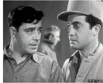
1943 YOU CAN' BEAT THE LAW de Phil Rosen avec Edward Norris