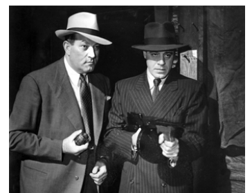
1948 PAS D'ORCHIDÉE POUR MISS BLANDISH de St. John Legh Clowes avec Dany Green