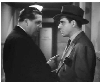
1944 THE LAST RIDE de D. Ross Lederman avec Cy Kendall