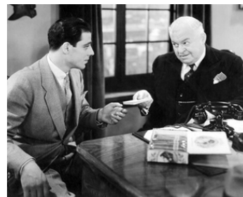
1935 CALLING ALL CARS de Spencer Gordon Bennet avec Harry Holman