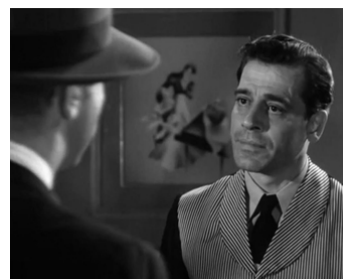
1945 PRIS AU PIÈGE (Cornered) d'Edward Dmytryk avec Dick Powell