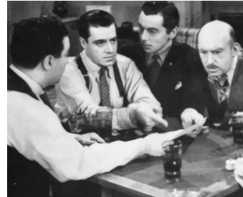
1941 PAPER BULLETS de Phil Rosen avec Vince Barnett