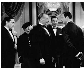
1935 AGENT SPÉCIAL (Special Agent) de William Keighley avec Bette Davis, Ricardo Cortez