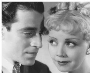
1934 LE SECRET DU CHÂTEAU (Secret of the Château) de Richard Thorpe avec Claire Dodd