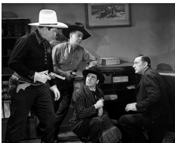
1943 THE LAW RIDES AGAIN d'Alan James avec Ken Maynard, Hoot Gibson, K. Harlan