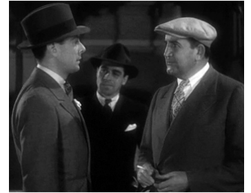
1933 42 e RUE (42nd Street) de Lloyd Bacon avec George Brent, Tom Kennedy