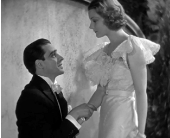
1933 LA PHALÈNE D'ARGENT (Christopher Strong) de Dorothy Arzner avec Helen Chandler