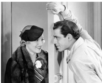
1934 NO RANSOM de Fred C. Newmeyer avec Leila Hyams