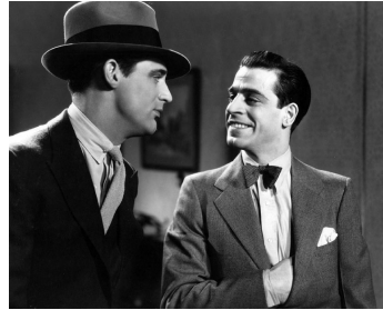
1933 CELLE QU'ON ACCUSE (The Woman accused) de Paul Sloane avec Cary Grant