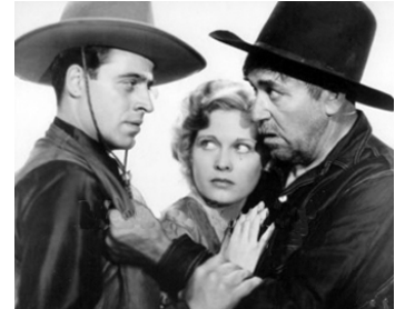
1933 JUSQU'AU DERNIER HOMME (To the Last Man) d'H. Hathaway avec E. Ralston, B. McLane