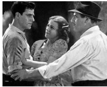
1937 TRAPPED BY G-MEN de Lewis D. Collins avec Wynne Gibson, Jack Holt