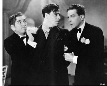
1939 THE GANG'S ALL HERE de Th. Freeland avec Edward Everett Horton, Jack Buchanan