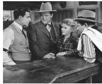
1938 LA VALLÉE DES GÉANTS de W. Keighley avec Ch. Bickford, Claire Trevor, Fr. McHugh