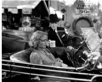
1933 THE STORY OF TEMPLE DRAKE de Stephen Roberts avec Miriam Hopkins