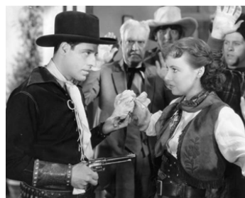
1936 A TENDERFOOT GOES WEST de Maurice G. O'Neill avec Virginia Carroll