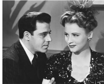
1942 HYÈNES DES BAS-FONDS (X-Marks the Spot) de George Sherman avec Anne Jeffreys